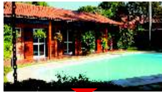
INTERLAGOS Térrea maravilhosa

Próximo ao parque, imponente sobrado com ambientes amplos. Ref 523624