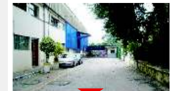
RAÍPO TAVARES Andar inteiro

Área urbana ao lado do Rodoanel, estudo para 1.400 casas comérc/condução, zona sul. Ref 520372