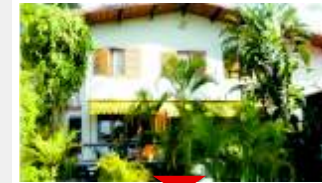
CHÁCARA MONTE ALEGRE Ótimo local

Condomínio fechado, Brooklin Velho, 4 suítes, 6 vagas na garagem com muito jardim, venda rápida. Ref 517309