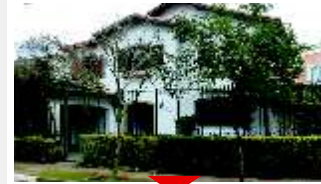
ALTO DA BOA VISTA Imperdível

Lindo sobrado com 4 dormitórios sendo (2 suítes), repleto de armários, 4 vagas, 250m 2 de área construída. Ref 522200