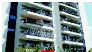
ALTO DA BOA VISTA Belo Apartamento

250m 2 AU, 4 vagas, 3 suítes, sala íntima, living, sacada, salas de jantar e almoço, andar alto, piscina. Ref 522480