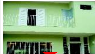
CAMPO BELO Reformado

4 suítes, master com lareira, escritório, living 4 ambientes, lazer, piscina, jardim. Ref 62