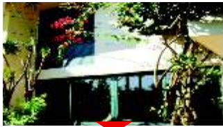
ALTO DA BOA VISTA Imperdível

3 dormitórios (suíte), salas de jantar e estar, 3 vagas de garagem. Ótimo preço. Ref 521767