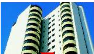
CAMPO BELO Requinte

250m 2 AU, 4 vagas, 3 suítes, sala íntima, living, sacada, salas de jantar e almoço, andar alto, piscina. Ref 522480