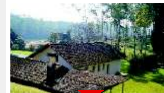
ITAIPERICICA DA SERRA 1.156.000m 2

Excelente localização, esquina Berrini, 200m 2 de área útil, 4 banheiros, 8 vagas. Oportunidade! R$ 1.000.000 Ref 521101