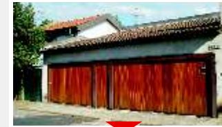
JARDIM PRUDÊNCIA Confira

Oportunidade, 4 suítes, jardim com piscina, rua arborizada e segura. Ref 51160