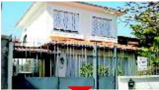
JARDIM LUZITANIA Confira

4 dormitórios (2 suítes), todas com AE, sala com lareira, piscina, jardim, ótima localização, excelente negócio. Ref 5843