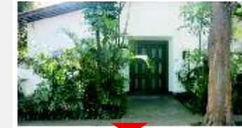
BROOKLIN 2000m 2 AT

920m 2 AT, 640m 2 AC, 4 dormitórios sendo 2 suítes, 3 salas, escritório, piscina, churrasqueira, 3 vagas. Ref 9726