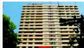
ALTO DA BOA VISTA Oportunidade

R$ 660 mill, 206m 2 de área útil, vista para Z1, amplo living com terraço, 4 vagas de garagem. Ref 523439